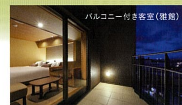
バルコニー付き客室(雅館)